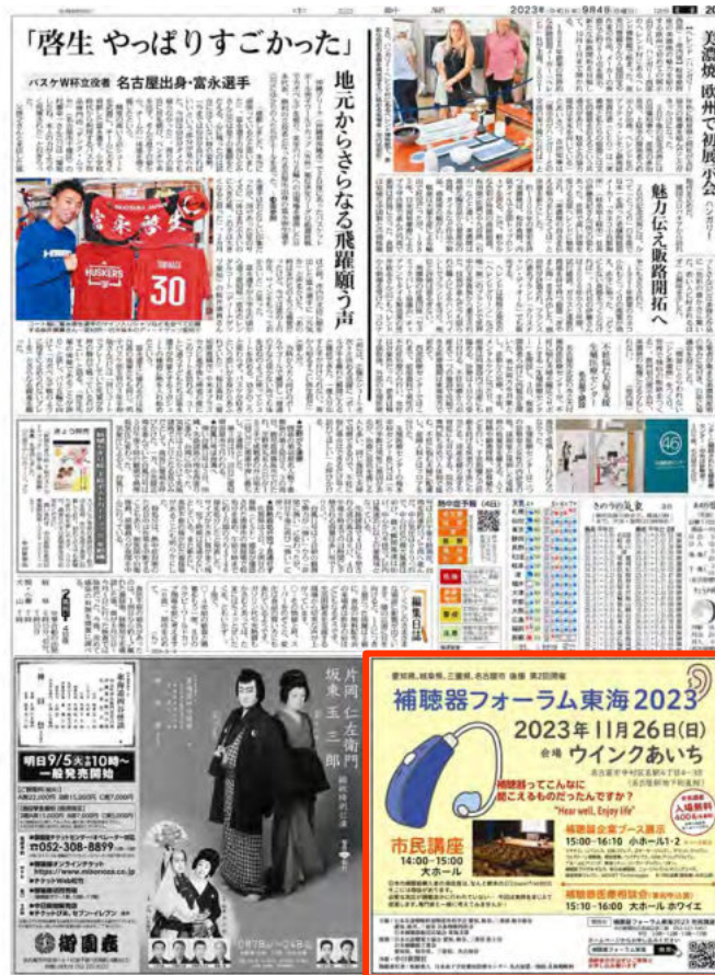
2023年9月4日付中日新聞朝刊 カラー半5段