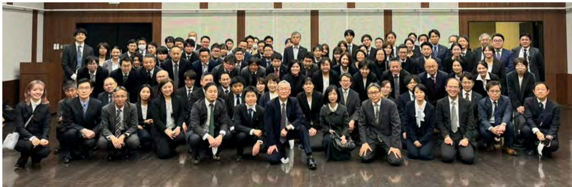
補聴器フォーラム東海実行委員 と 協賛、協力を頂いた方々