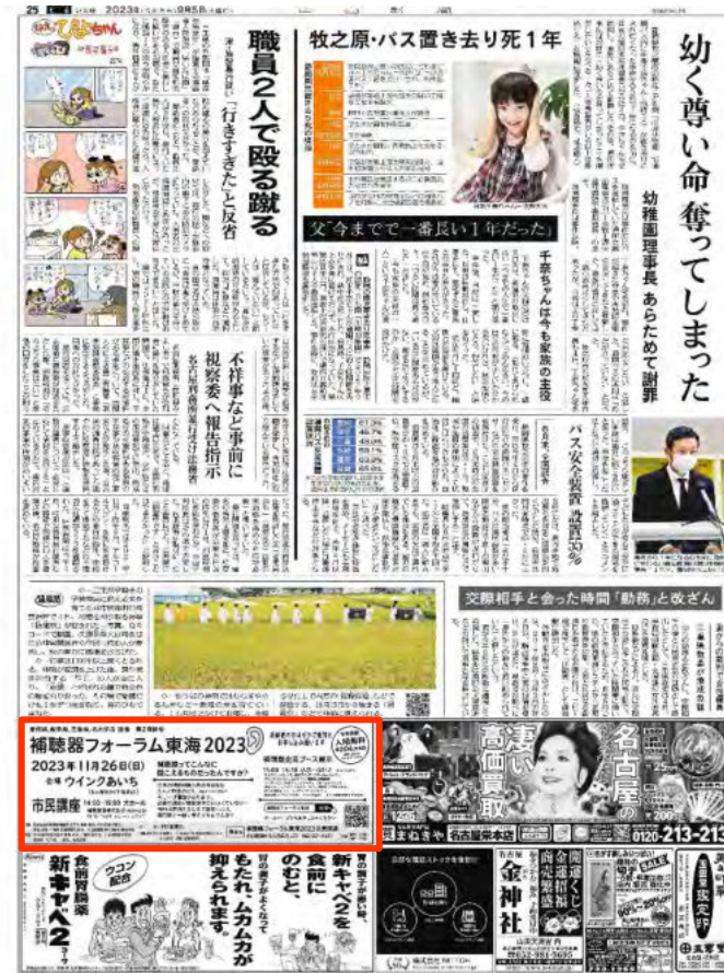
2023年9月5日付～中日新聞朝刊 社会面半2段モノクロ