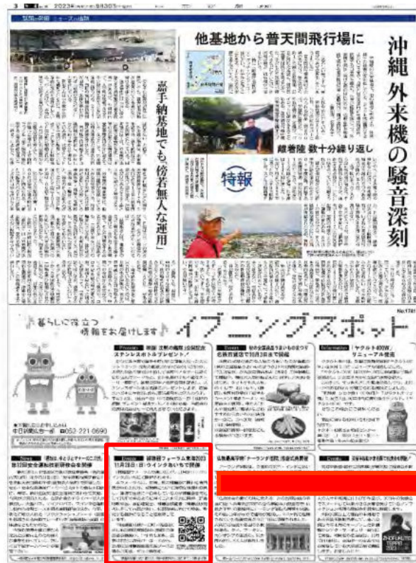
2023年9月30日付中日新聞夕刊