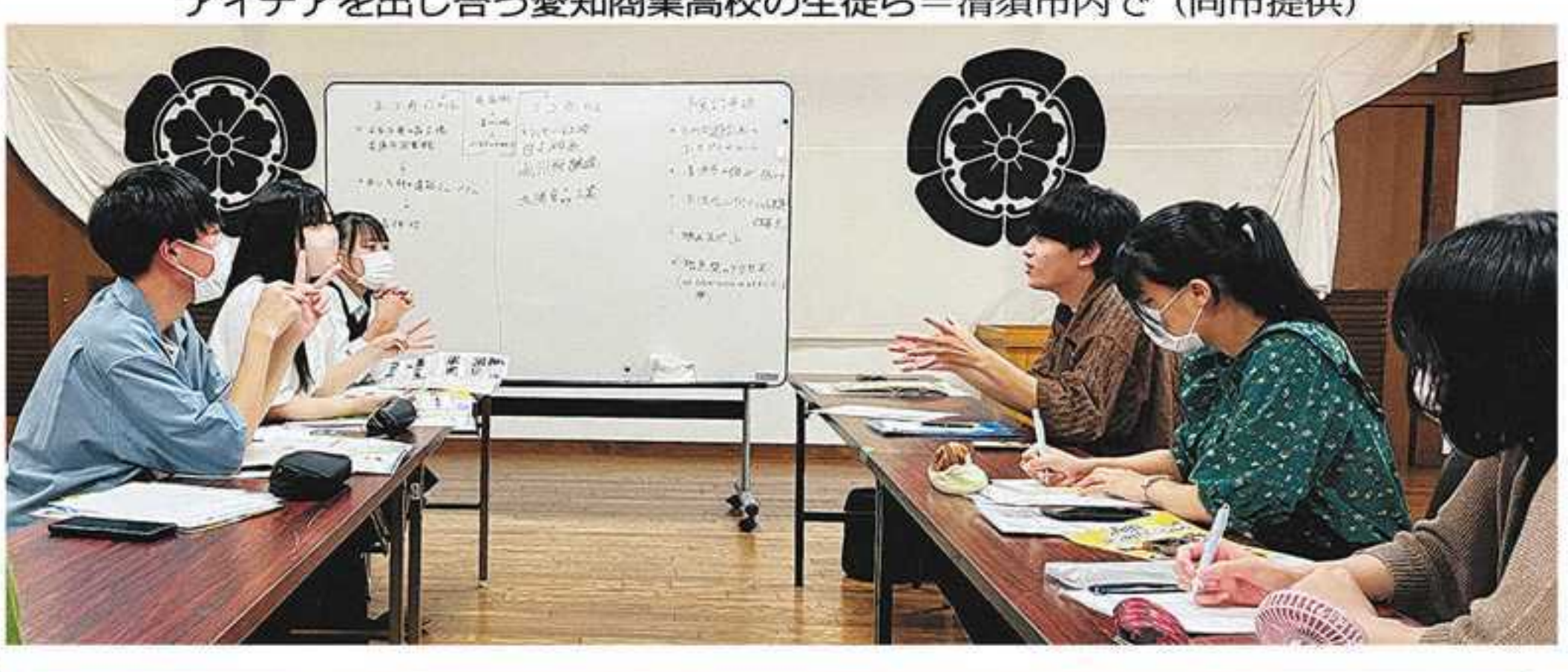
名古屋の学生ら企画参加「きよすイルミ」

織田信長が居城とした清須市の清洲城周辺で開催中のイルミネーション「きよすイルミ2023」で、名古屋の専門学生と高校生が企画役となり、活躍している。